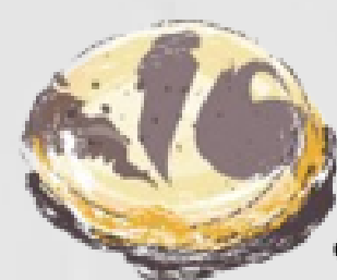
HOLLANDAIS sablé vanille et chocolat