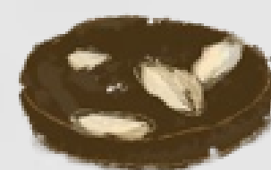
PALET CHOCOLAT sablé au chocolat et aux amandes

La biscuiterie artisanale de Bergholtz fabrique ses produits à base d'ingrédients naturels et dans le pur respect de la tradition alsacienne depuis 1983.